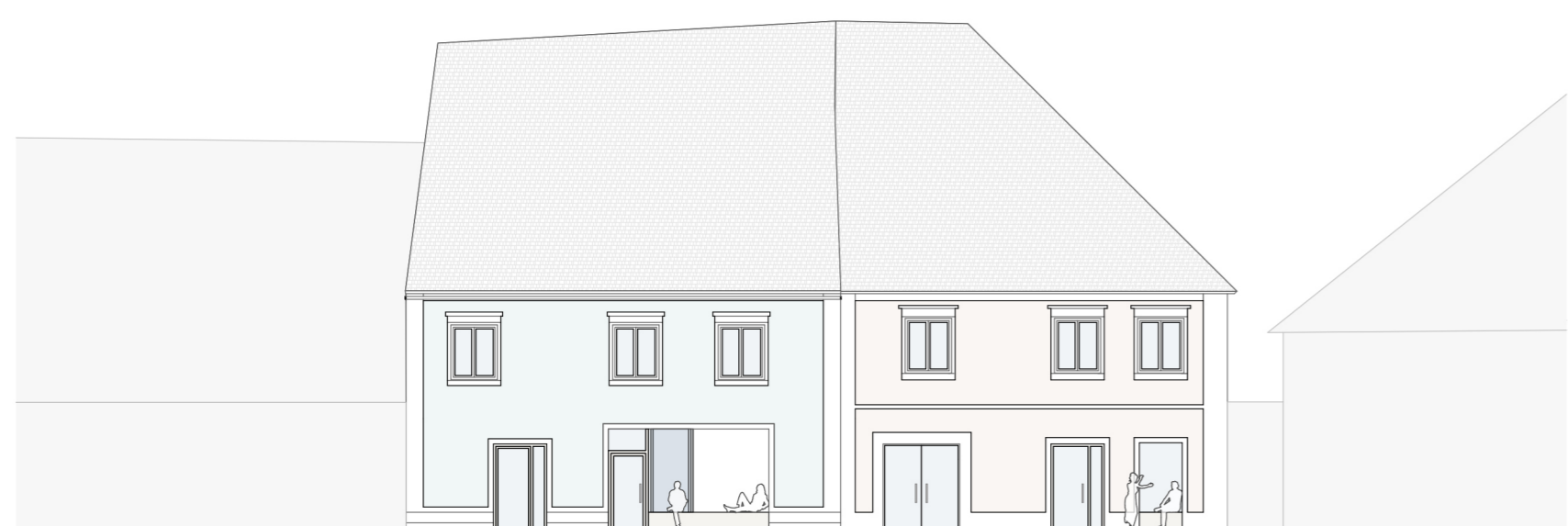
Ansicht Süd M:1:200